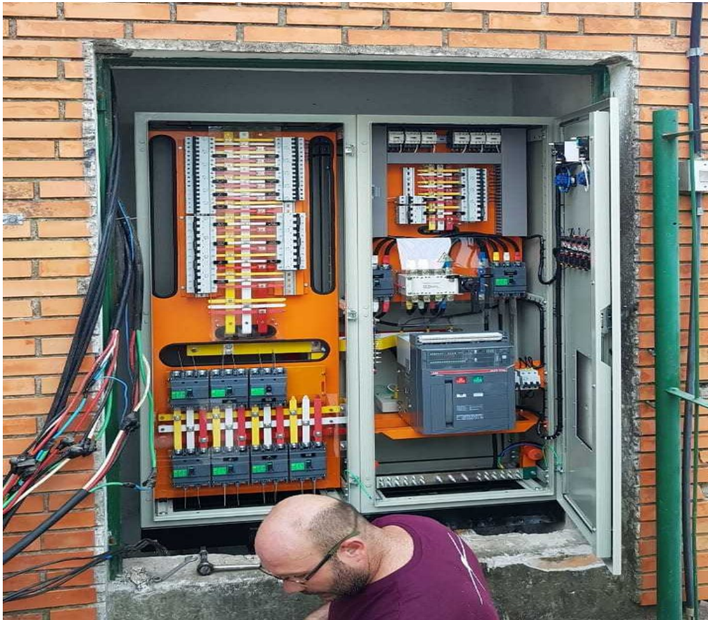
Quadro Geral de Baixa Tensão