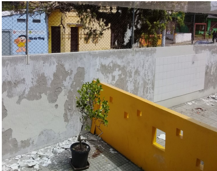
Conserto Pátios Internos Salas Infantil