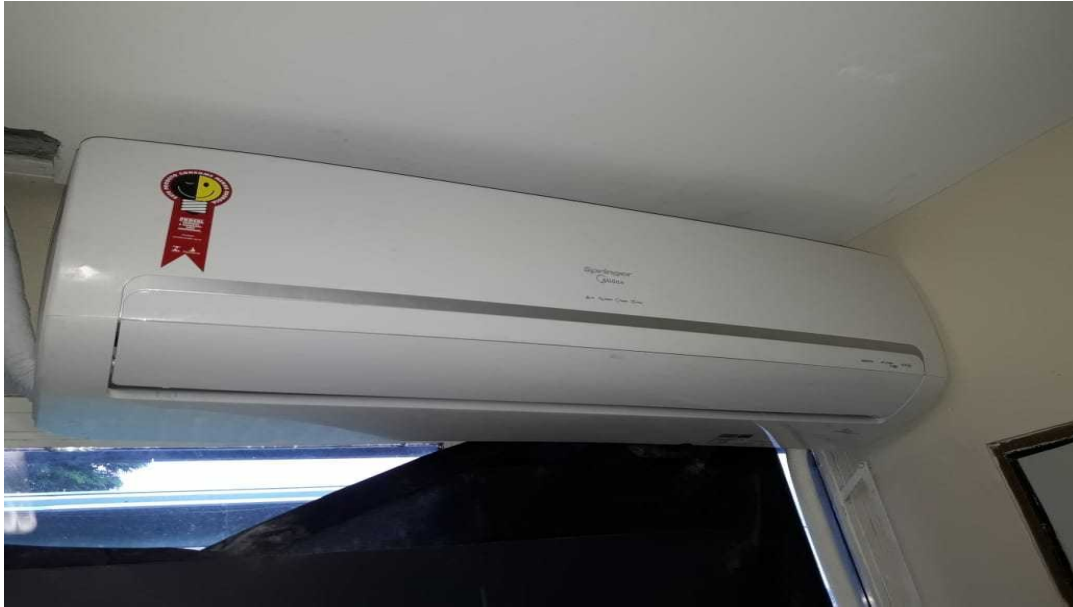
Ar condicionado Servidor T.I.