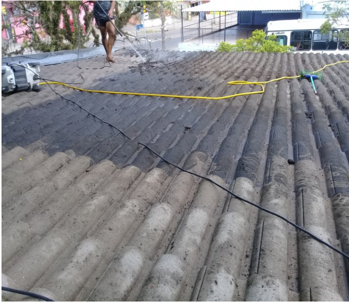
Limpeza Telhado Infantil