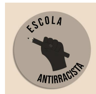
Fonte: Site da Escola – 2021 https://joaoxxiii.com/escola-antirracista-propoe-formacao-aos-profissionais-do-joao-xxiii/

IV. Ausentar-se do Colégio, das aulas e das atividades escolares sem a devida permissão;