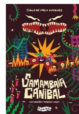
2ª leitura do semestre