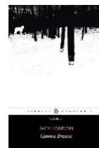
2ª leitura do semestre

Autor: Jack London Editor: Penguin-Companhia ISBN 9788563560858