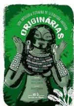
1ª leitura do semestre

Autor: Mauricio Negro Editor: Companhia das letras ISBN 9786581776879